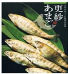
更紗あまごのカタログ

本事業は、ホテル・旅館、量販店、高速道路SA・PA、食品加工業者等の多様化するニーズに対応すべく、液体急速凍結機及び冷風乾燥機を導入し、付加価値の高い岐阜県産淡水魚商品の製造体制を確立し、学校給食以外の販路拡大を目指す。